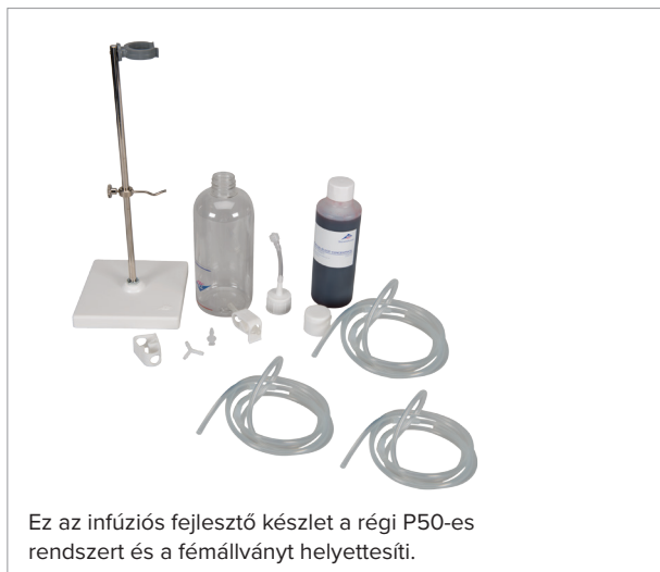
Régi infúziós rendszer