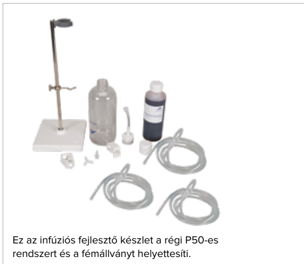
Régi infúziós rendszer