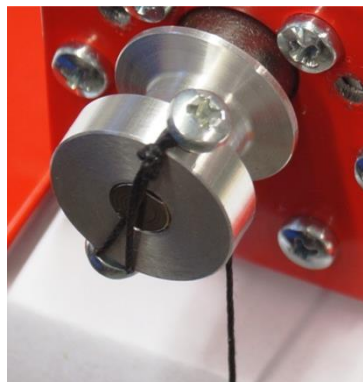
Fig. 1 Fijación del hilo