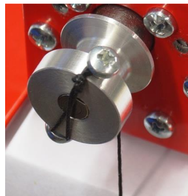
Fig. 1 Befestigung des Seils